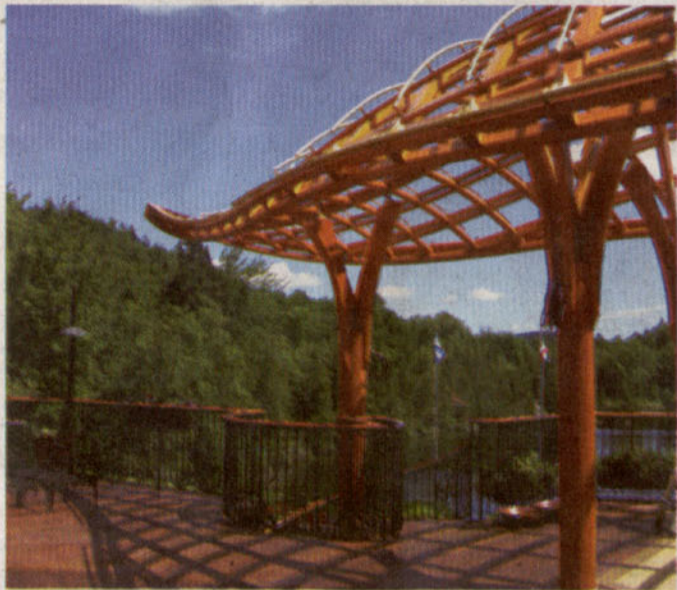
Les installations de Sollertia constituent une véritable architecture textile dotée d'une personnalité qui en fait toute l'originalité.